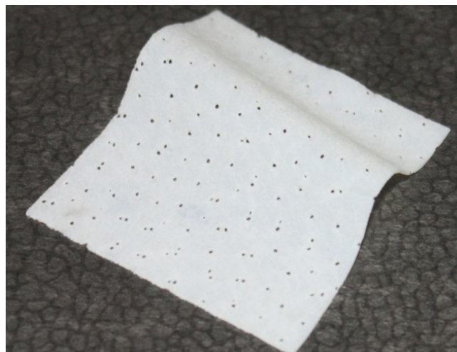
Рис. 2. Биологический имплантационный материал Permacol (Tissue Science Laboratories, Великобритания)

Средняя продолжительность ИВЛ в обеих группах была примерно одинаковой. Однако пациенты второй группы чаще нуждались в ВЧ ИВЛ, что свидетельствовало об их более тяжелом кардиореспираторном статусе. Тем не менее, межгрупповое различие по этому показателю было статистически недостоверным — возможно, в связи с небольшой выборкой.