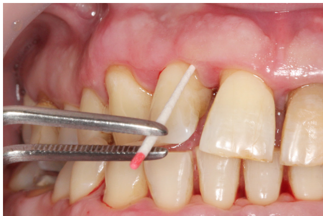
Рис. 2. Забор содержимого пародонтального кармана

В работе Зориной и соавт. [35] проанализирована представленность видов и родов бактерий в микрофлоре пародонта пациентов с агрессивным пародонтитом и лиц со здоровым пародонтом. В исследовании выявлено 6 родов потенциальных пародонтопротекторов и 8 родов потенциальных пародонтопатогенов, имеющих отношение к риску возникновения агрессивного (но не хронического) пародонтита.