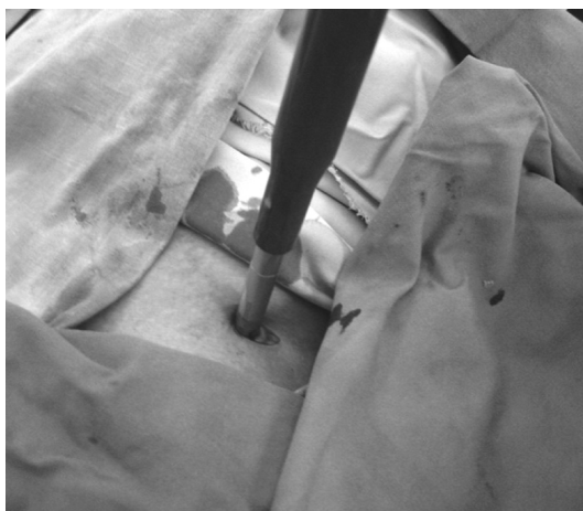
Рис. 4. Взятие ауто трансплантата из гребня подвздошной кости.