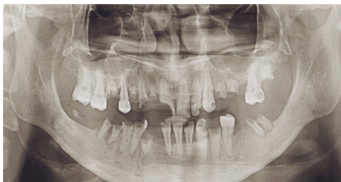
Рис. 1. Ортопантограмма пациентки С., 41 год, на момент начала лечения

За период наблюдения периодонтальное пространство прослеживалось на всем протяжении поверхности корней зубов 1.1–1.3. После проведения реплантации признаки