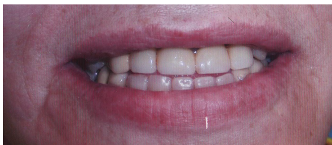
Рис. 5. Та же пациентка. Общий вид рта после установки ортопедических конструкций на реплантированные зубы. Период наблюдения длился 2 года

патологии костной ткани в области корней указанных зубов отсутствовали. Данное наблюдение позволяет сделать предположение о наличии процесса фиброостеоинтеграции данных зубов.