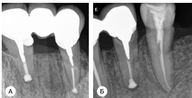
Рис. 3. (А, Б). Прицельная рентгенография реплантированных зубов 1.1–1.3, 3.4 у той же пациентки