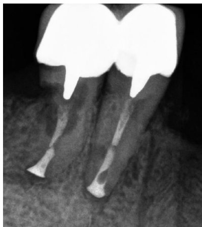
Рис. 4. Прицельная рентгенография реплантированных зубов 4.4, 4.5 у той же пациентки